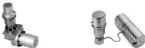
Figure 1 : exemples de détecteurs Sofradir IR refroidis avec des machines cryogéniques

La détection Infrarouge (IR) haut de gamme est basée sur des détecteurs quantiques plans focaux (FPA) qu'il faut refroidir, de façon plus ou moins importante (de - 200 °C à - 80 °C) selon la gamme de longueurs d'onde du détecteur, pour obtenir leurs pleines performances. Ces détecteurs (voir exemples figure 1) sont donc couplés avec des refroidisseurs (machine cryogéniques suivant un cycle thermodynamique ou détente de gaz).